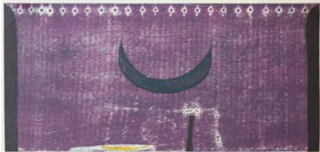
O.T. (1962), Materialdruck 6-4, 27 x 51 cm