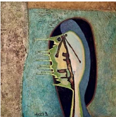
Maskenhaft (1958), Öl auf Hartfaserplatte, 55 x 55 cm