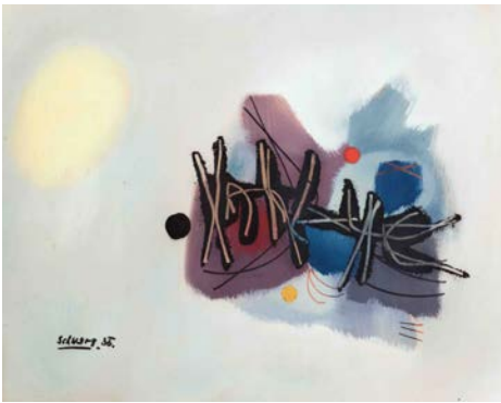
O.T. (1956), Öl auf Karton, 48 x 68 cm

So entfaltet sich hier die Erzählung eines Jahrzehnts der Suche und der konsequenten künstlerischen Selbstfindung.